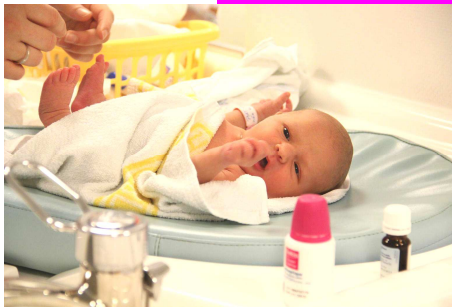
Le bain et soins pur bébé, dans la salle de nursing