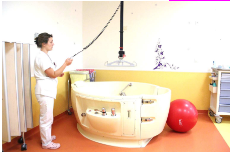
La salle d'accouchement dite « salle nature »