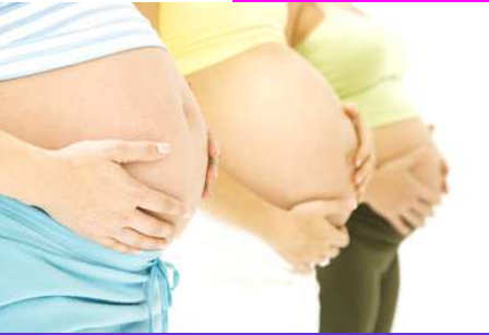
Cours de préparation à la naissance