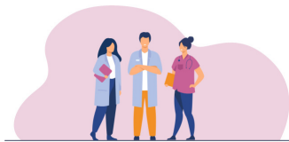
Professionnels de la périnatalité et de la santé