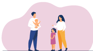
Futurs et jeunes parents